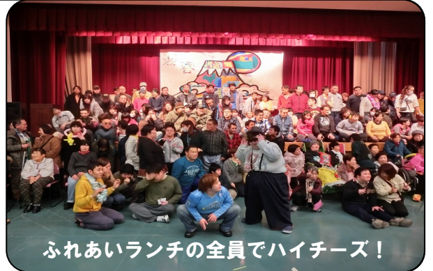
ふれあいランチの全員でハイチーズ!

いつもながらのわかりやすく、興味を引くお話で、メンバーの皆さんも職員も真剣に耳を傾けていました。一時間と言う短い時間でしたが、お医者様との関係の取り方やお薬・周囲との関係・ストレスのことそして日頃の生活習慣を見つめ直すなど、中身の濃い時間でした。